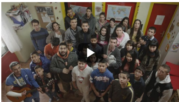
A tudás hatalom

személyes segítők. Az egymás korrepetálása, a helyi szükségletekre épülő speciális tanuló-csoportok szervezése reményeket ébreszthet a tanulásban, képzésben lemaradó, iskolából kikerülő fiatalok felkarolására, megtartására, fejlesztésére.