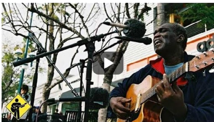
Stand by Me

A fiataloknak, mint a jövő békéjét létrehozóknak és fenntartóknak, különösen fontos, hogy megértsék az erőszak létrejöttének okait, folyamatát, megelőzési lehetőségét, kezelésének módszereit. Minden aktív közösségben törvényszerűen megjelenik a konfliktus, az erőszak. Hiú remény azt gondolni, hogy bármilyen emberi együttműködésből ez kiküszöbölhető. Az erősen heterogén ifjúsági csoportokban fokozottan van jelen, és fokozott erőfeszítést igényel a kezelése, megoldása, illetve megelőzése.